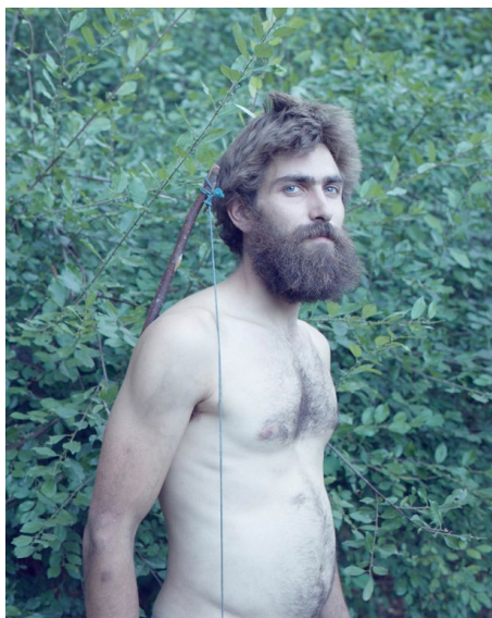
Figura 1.- Jorge Fuembuena (2014), Historias de madera (c-print, 120 x 100 cm acrílico sobre lienzo, 1,70 x 1,50 cm.)